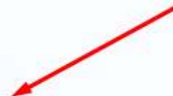
Схема отсутствует в государственных органах и подведомственных организациях