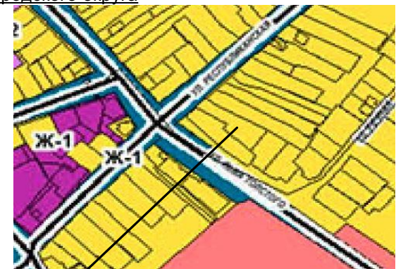
г. Алексеевка, ул. Республиканская, 126

Расположение земельного участка на карте градостроительного зонирования Правил землепользования и застройки Алексеевского городского округа