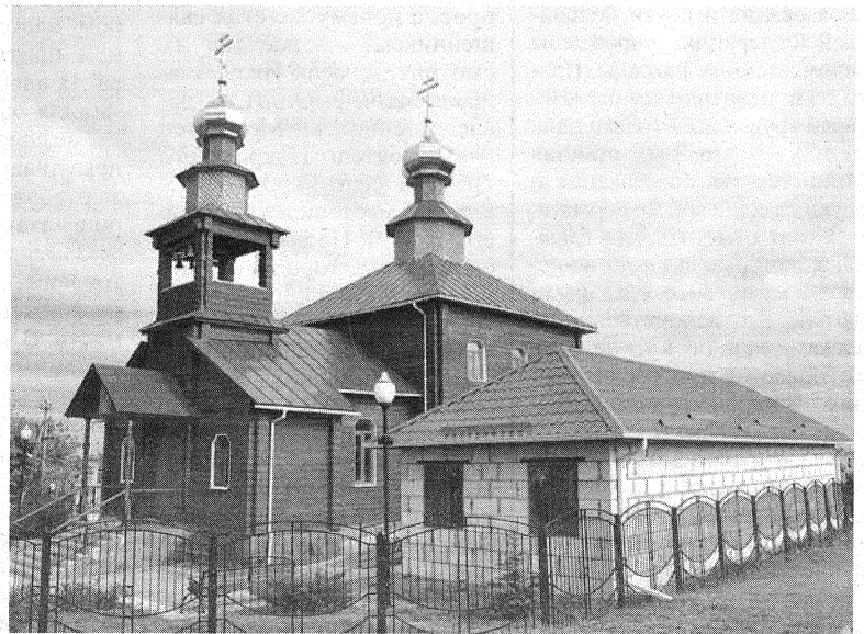
Строящаяся воскресная школа возле сельского храма.