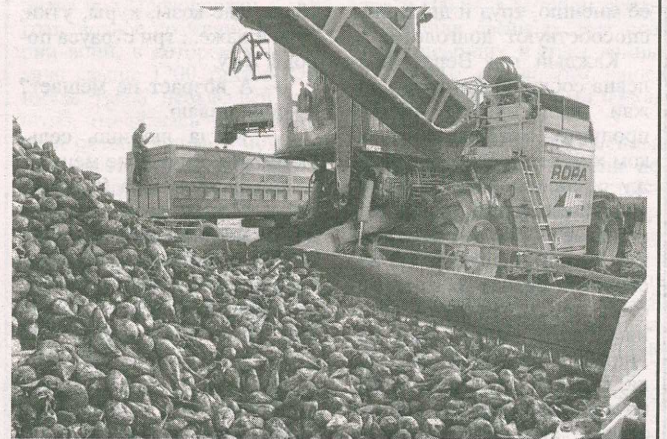
Действует погрузочный агрегат.